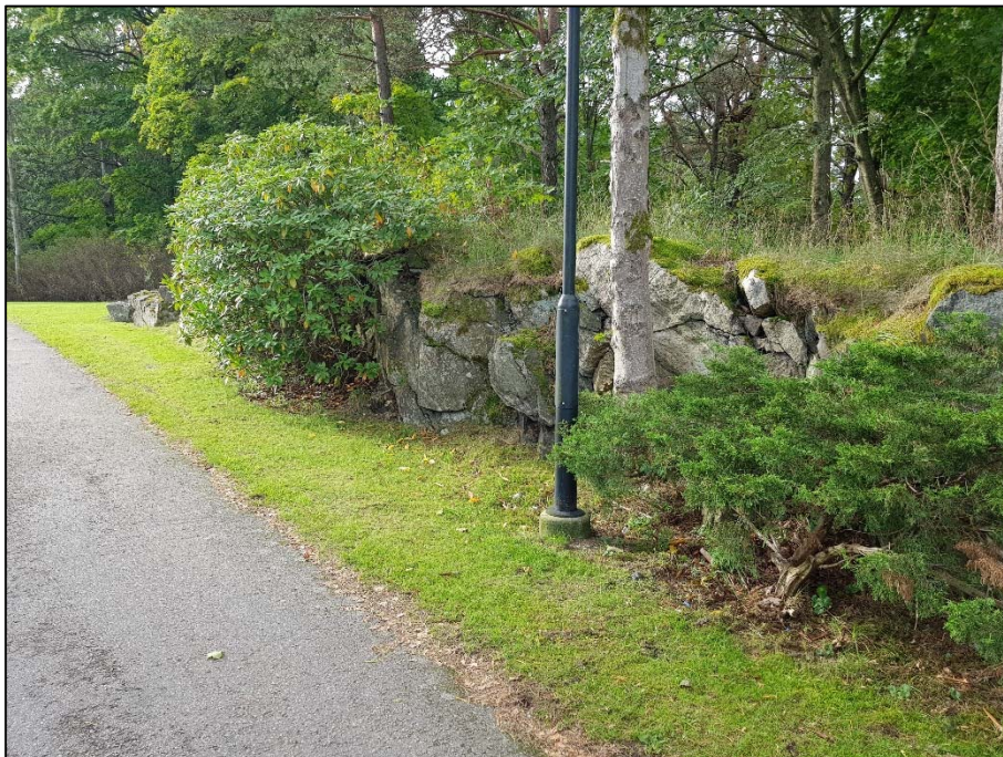
Figur 5. C, Låg bergslänt i nordvästra delen av programområdet.