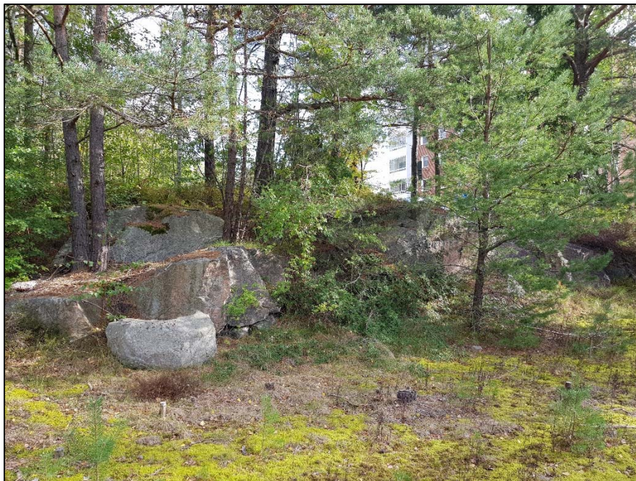
Figur 6. D, Naturlig bergslänt centralt i programområdet.