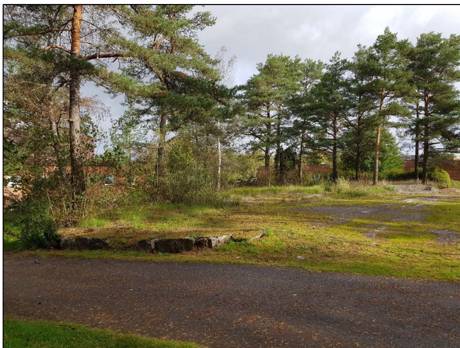
Figur 7. E, Flack bergyta centralt i programområdet.