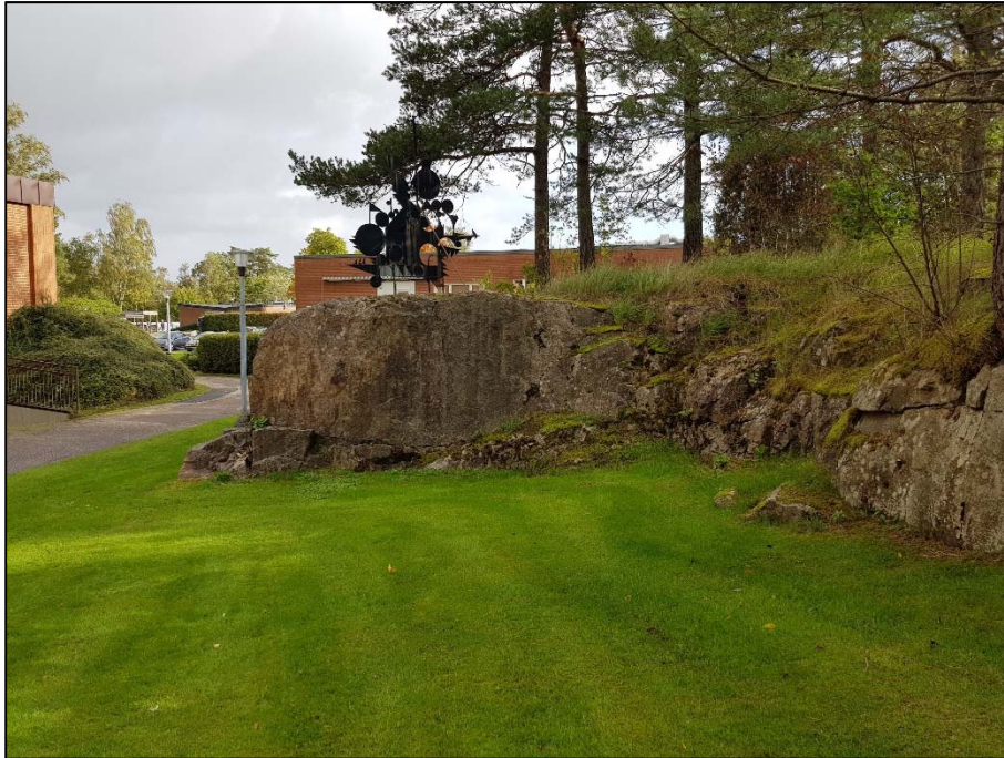
Figur 4. B, Naturlig bergslänt centralt i programområdet.