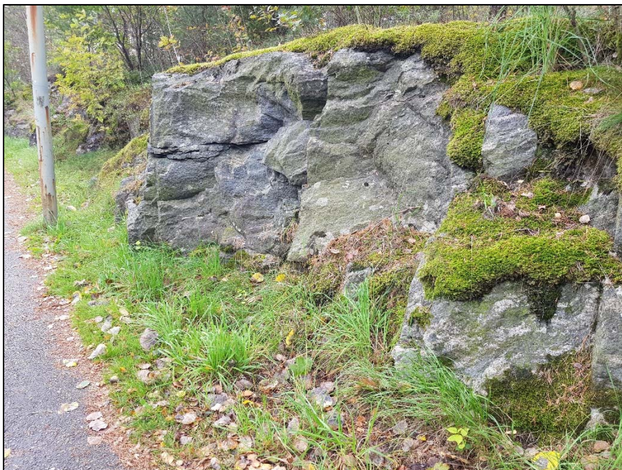
Figur 9. G, Sprängd bergskärning längs trottoaren vid Lasarettsvägen.