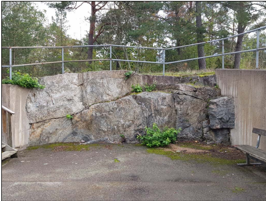
Figur 8. F, Sprängd bergskärning i nordöstra delen av programområdet.