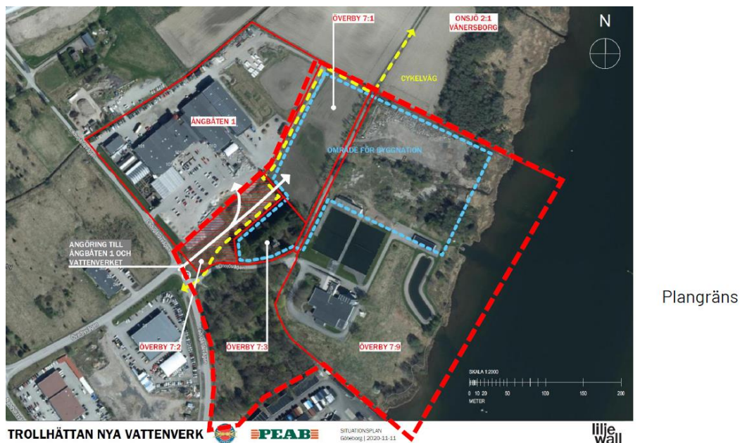
Figur 1. Planområdet.

Ett nytt vattenverk planeras i Trollhättan och en ny detaljplan håller på att tas fram. Eftersom planen får påverkan på befintligt gatunät och cykelnät behöver ett utformningsförslag tas fram. Vidare behöver en dialog föras med Trollhättans och Vänersborgs kommuner om framtida kopplingar mellan kommunerna då planen gränsar till kommungränsen. Planområdet visas i Figur 1.