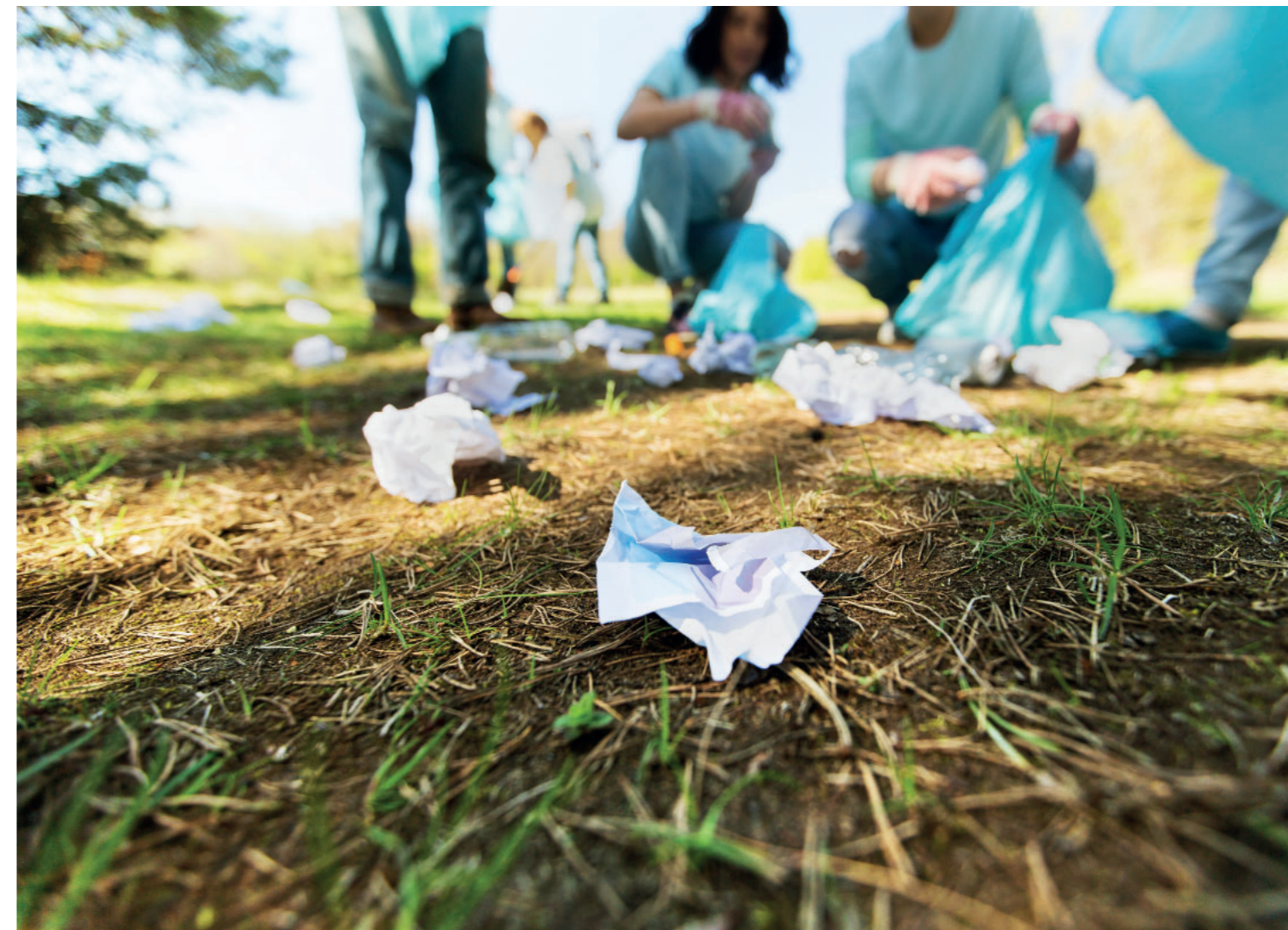
Att plocka skräp – och att helt undvika att skräpa ned – bidrar till finare, säkrare och tryggare platser.

Fotnot: Du kan alltid vara anonym när du kontaktar rådgivningen – och den nås också på telefonnummer 49 54 10.