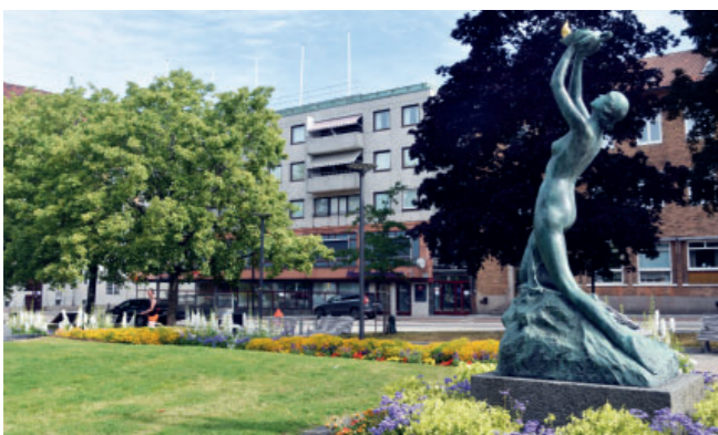
Heliga lågan är en av många kända konstverk som kan beskådas i Trollhättan. Läs mer på sidan 12.