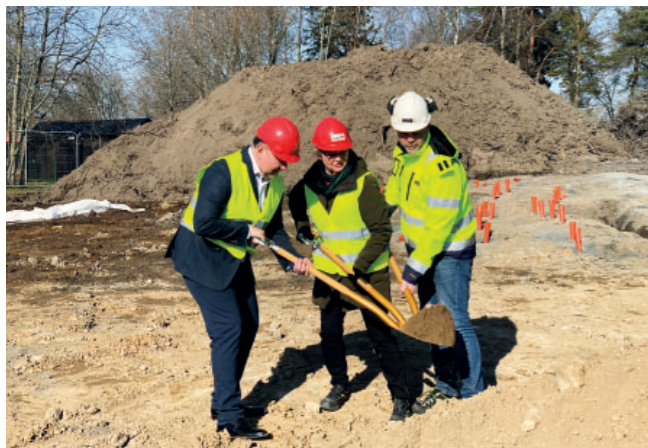
Spadtag för nytt boende på Hagtornsstigen . Läs mer på Sidan 10.