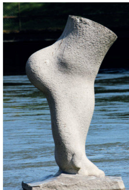
En nästan 3 meter hög skulptur i granit av Viktor Korneev pryder vattnet vid Malgön. Namnet ”Touch” syftar på att fotens tår doppas i vattnet när vattennivån i kanalen höjs.