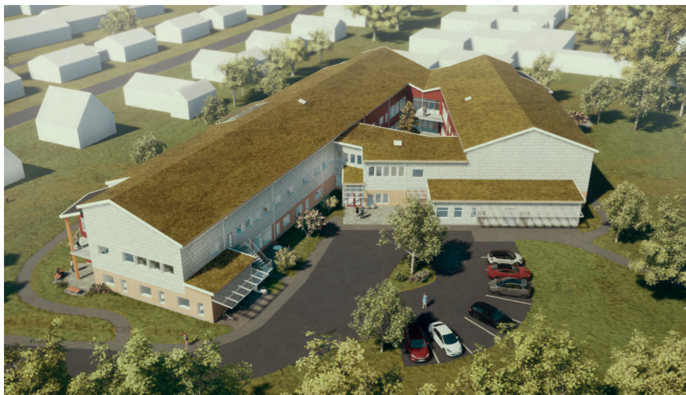
Så här ska det nya vård- och omsorgsboendet se ut. Illustration: Eidar & Nils Andréasson Arkitektkontor