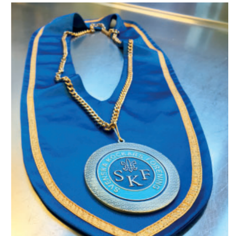
Cordon Bleu – utmärkelsen som Håkan Ohlsson är oerhört stolt över att bära.

Bleu fanns och sedan dess har målet varit att få en så ädel medalj, den slår högre än både VM- och OS-silver. Den betingar något som jag har gjort över tid och jag är oerhört stolt över att få bära den, avslutar Håkan.