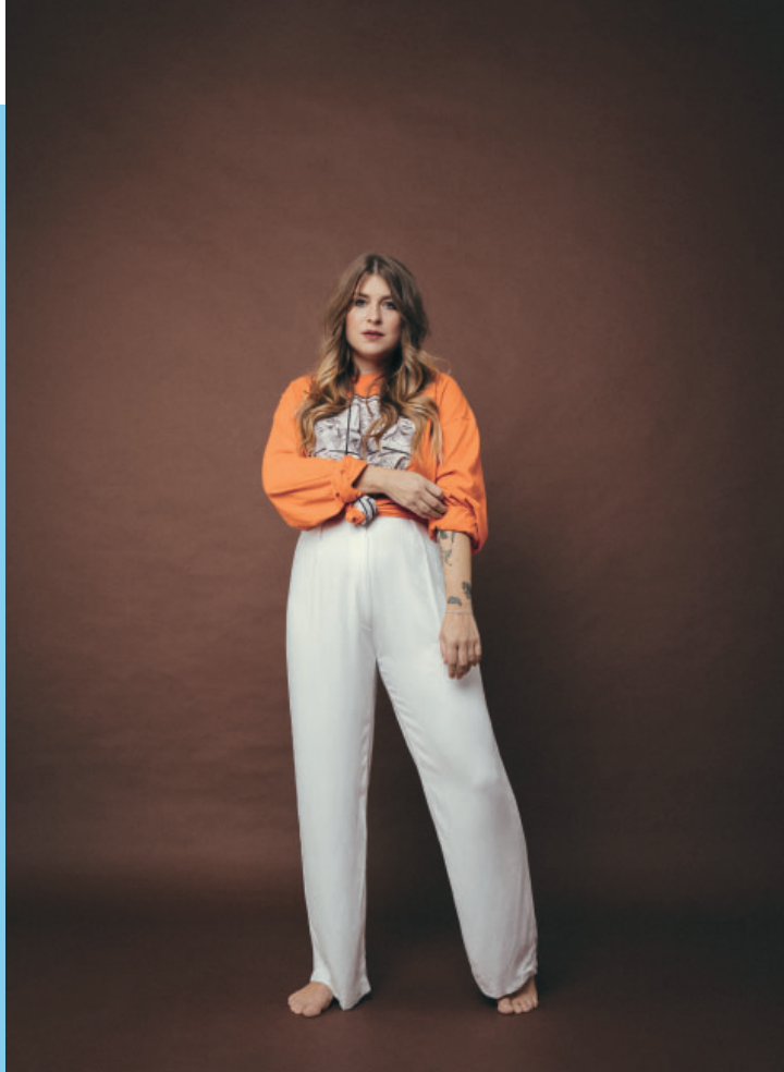
Linnea Henriksson är en av många kända artister som gästar Fallens Dagar i sommar.