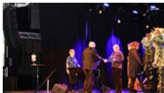
Diplomutdelning på scenen.